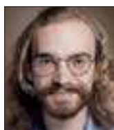
Matthieu BABIAR et Séverine DUCHÊNE Réalisateur du film