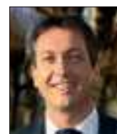
Jérôme END Président du Parc naturel régional de Lorraine