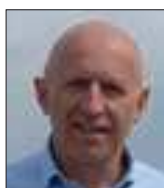
Dominique POTIER Agriculteur et député de Meurthe-et-Moselle