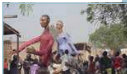
© Élodie Dondaine - Mathieu Villard - ACMUR

Les Grandes Personnes de Boromo, dites aussi les marionnettes géantes d'Afrique, sillonnent les rues du continent et au-delà pour émerveiller petits et grands. Raconter leur histoire c'est raconter celle des petites personnes qui se cachent sous chaque géant et de toute une communauté. Des artistes et surtout des hommes et des femmes qui, au quotidien, sont des paysans, des chefs de famille, des commerçants, des habitants de cette terre multiethnique qui les unit : le Burkina Faso.